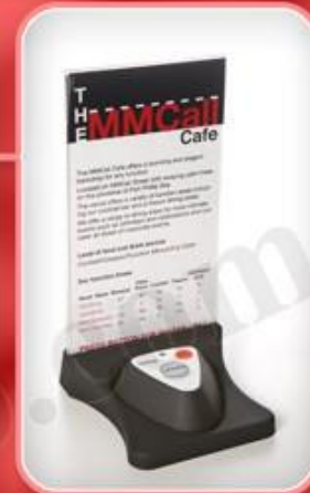
دکمه های روی میز مدل E