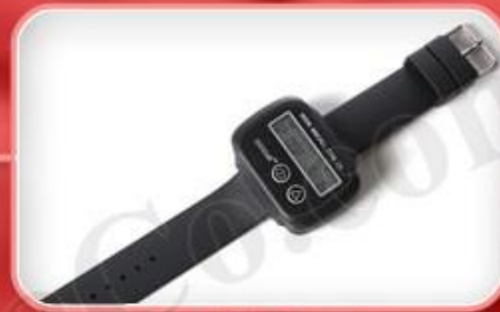
ساعت مچی گارسون