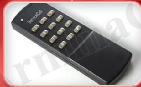
کنترل از راه دور