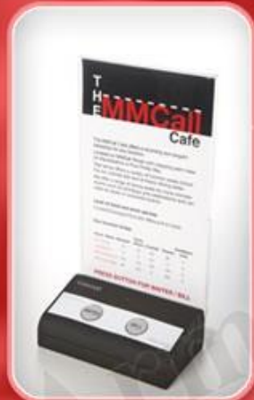
دکمه های روی میز مدل B