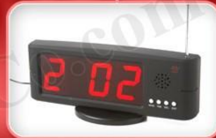
نمایشگر مدل F