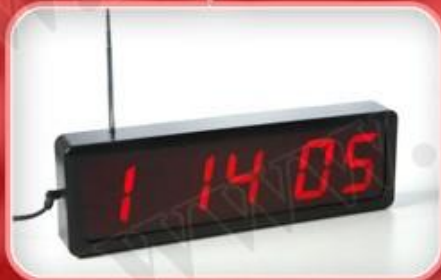
نمایشگر مدل E