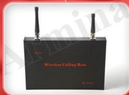
کنترلر مرکزی سیستم